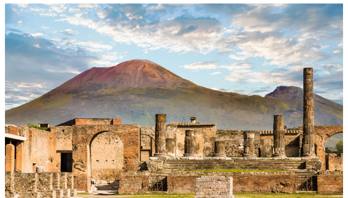
Pompeji & Vesuv

Nach dem Frühstück führt Sie der letzte Ausflug in Richtung des wohl bekanntesten Vulkans in Europa, dem Vesuv, der im Jahre 79 n.Chr. die wohlhabende Handelsstadt Pompeji unter einer 12m dicken Schicht aus Lava begrub. Der Parkplatz liegt auf ca. 1000 m Höhe, der restliche Aufstieg über 200 Höhenmeter bis zum Krater wird zu Fuss in ca. 20 Minuten erfolgen (gute Schuhe werden empfohlen). Vom Vesuv aus besuchen Sie anschliessend die Ausgrabungen von Pompeji, welche zum UNESCO-Weltkulturerbe zählt. Tauchen Sie ein in die Geschichte der antiken Stadt. Da die Asche des Vulkans die Stadt über Jahrhunderte hinweg konservierte, ist in Pompeji viel mehr erhalten geblieben als von anderen antiken Städten.